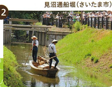
見沼通船堀(さいたま市)