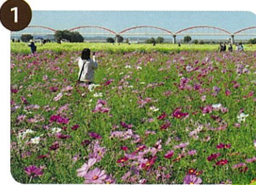
吹上コスモス畑(鴻巣市)