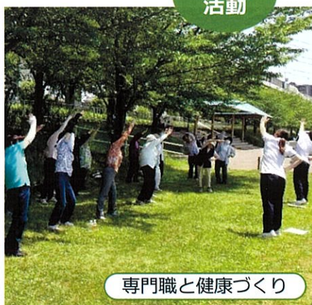
専門職と健康づくり