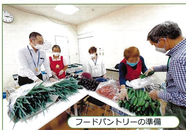
フードパントリーの準備